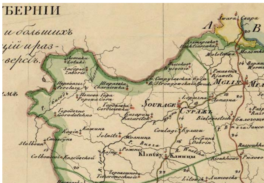
Фото 1. Карта Черниговской губернии Верецкакой волости Суражского уезда.