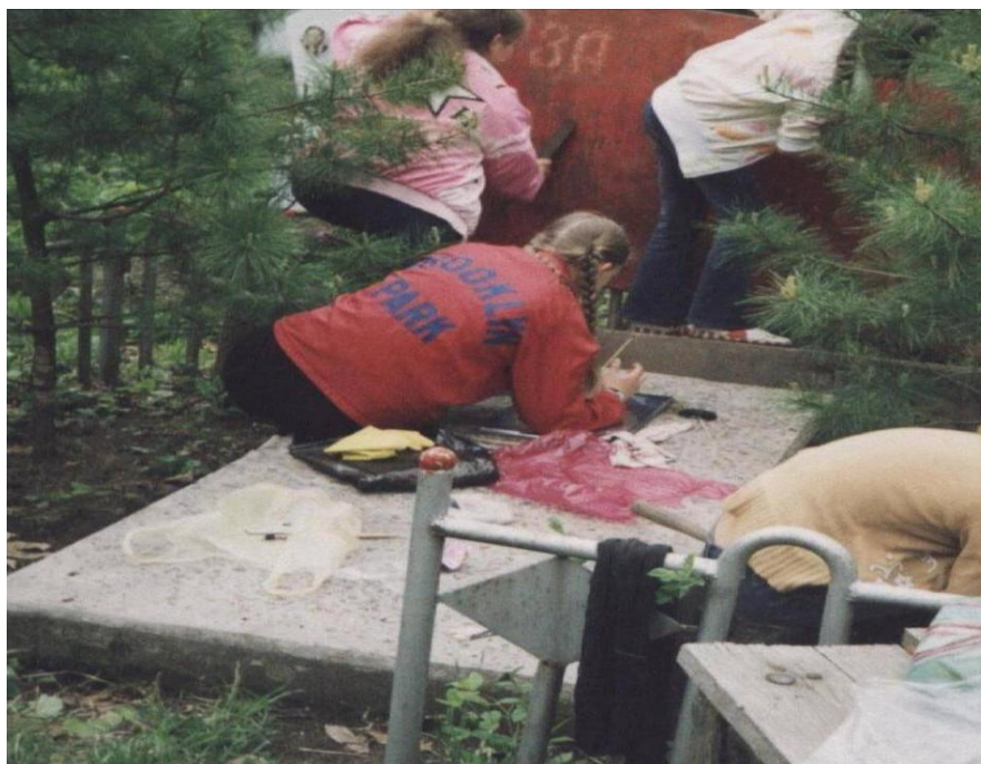
Фото 5. Могила партизан Борисенко М.А., Неводнюк Ф.Б. Находится на кладбище села Суражевка.