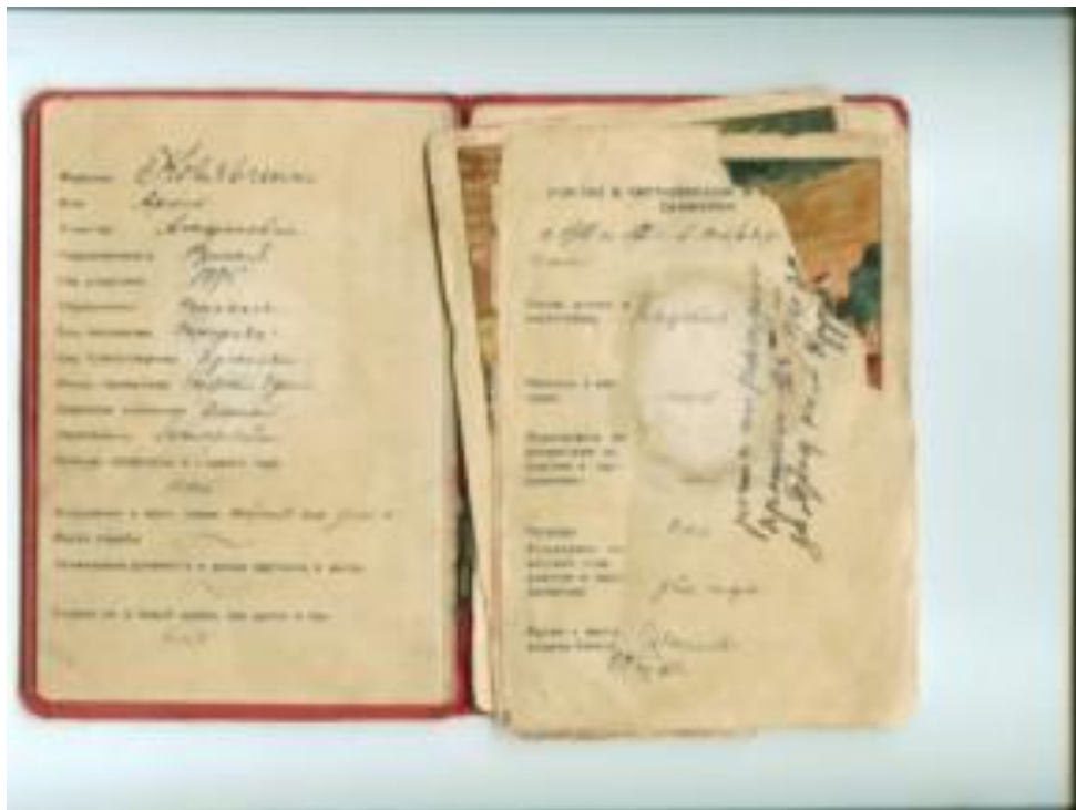
Фото 4. Партизанский билет Коржавченко Архипа Агафоновича.