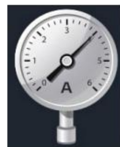
Рис. 2. Датчик абсолютного давления

Технические характеристики датчика абсолютного давления: