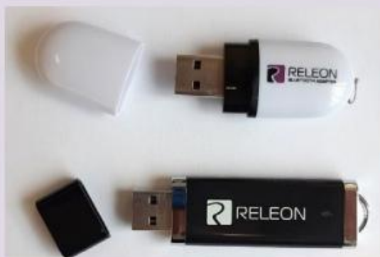
Рис. 13. Общий вид USB-флеш-накопителя (внизу) и Bluetooth-адаптера (вверху) Releon

В комплекте цифровой лаборатории Releon поставляется программное обеспечение Releon Lite на USB-флеш-накопителе, а также Bluetooth-адаптер для связи регистратора данных с беспроводными датчиками (рис. 13).