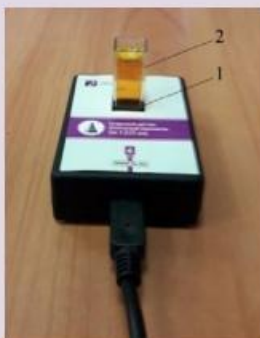
Рис. 1. Датчик оптической плотности: 1 — гнездо для кюветы; 2 — кювета для исследуемого вещества

Датчик температуры платиновый — простой и надёжный датчик, предназначен для измерения температуры в водных растворах и в газовых средах. Имеет различный диапазон измерений от -40 до +180 °С. Технические характеристики датчика указаны в инструкции по эксплуатации.