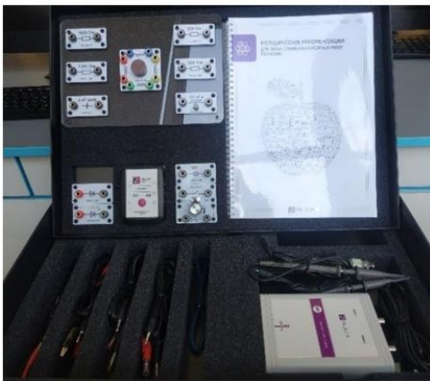
Рис. 1. Цифровая лаборатория по физике

Датчик (рис. 2) производит измерения абсолютного давления. Чувствительный элемент датчика выполнен на базе монолитного кремниевого пьезорезистора с внедрённой тензорезистивной структурой, которая позволяет исключить возможные погрешности и достигнуть необходимой точности измерений. В комплект датчика абсолютного давления входит гибкая герметичная трубка для подключения штуцера датчика к лабораторному оборудованию.